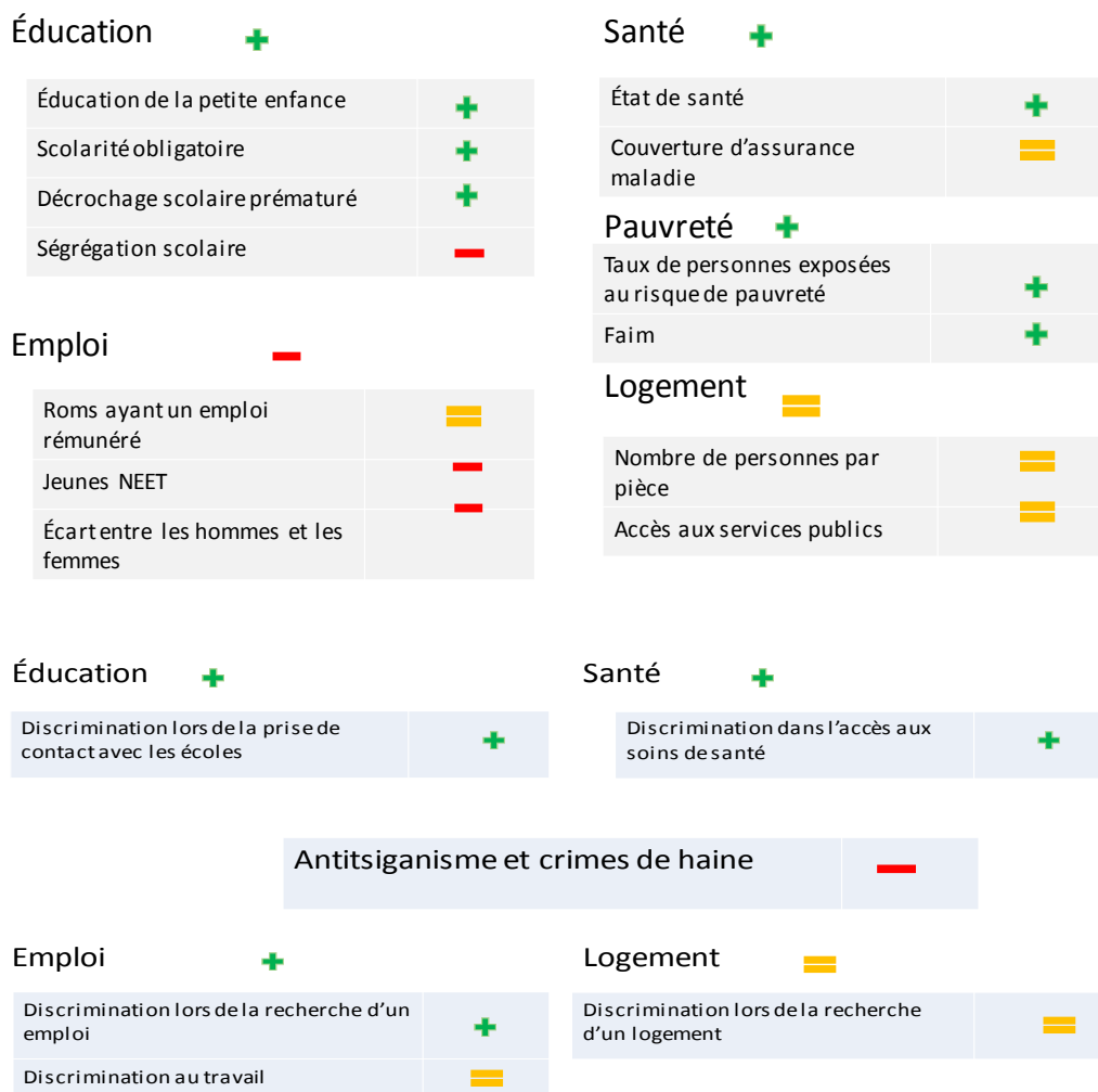
Diagramme n° 2: Évolution sur la période 2011-2016 de la situation des Roms dans les différents domaines, pauvreté; discriminations par domaine et antitsiganisme