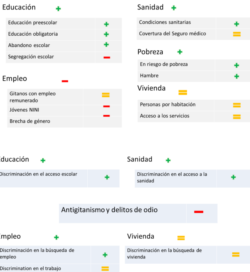
Gráfico 2: Cambios en el período 2011-2016 en la situación de la población gitana en los ámbitos políticos, pobreza, discriminación por ámbito y lucha contra el antigitanismo,